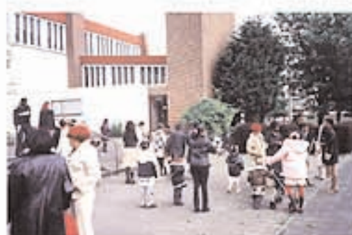
geloven = ontmoeten