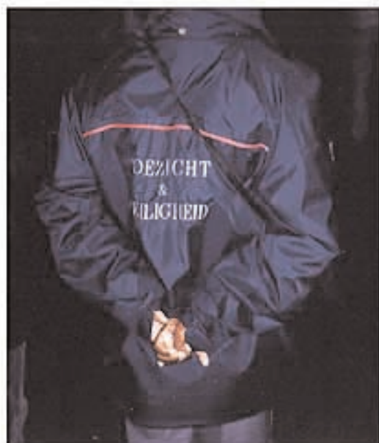
toezicht en veiligheid