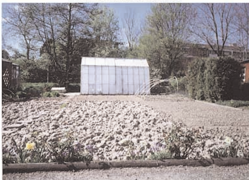
ons belang groente tuin