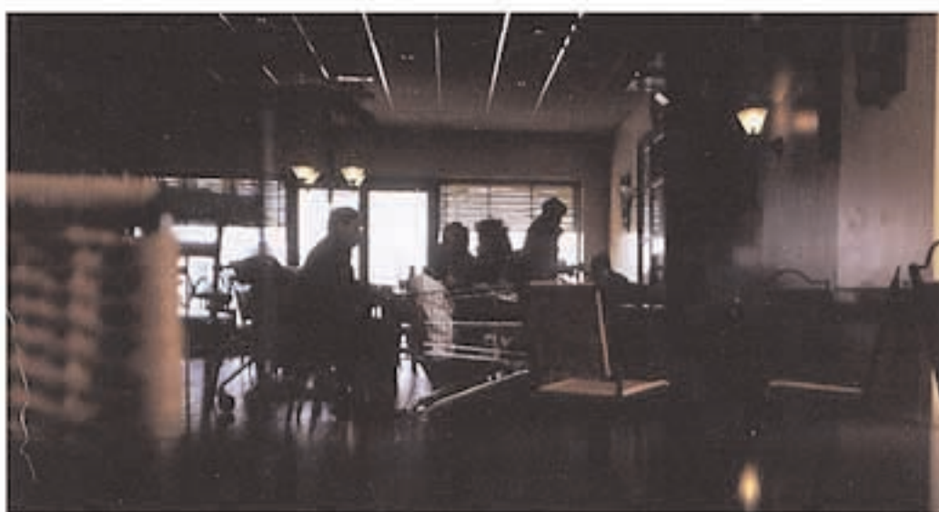
restaurant la place donker