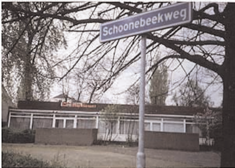
mfc satya dharma