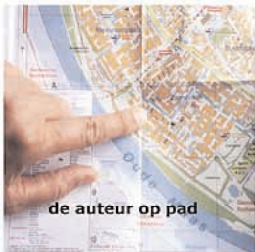
de auteur op pad