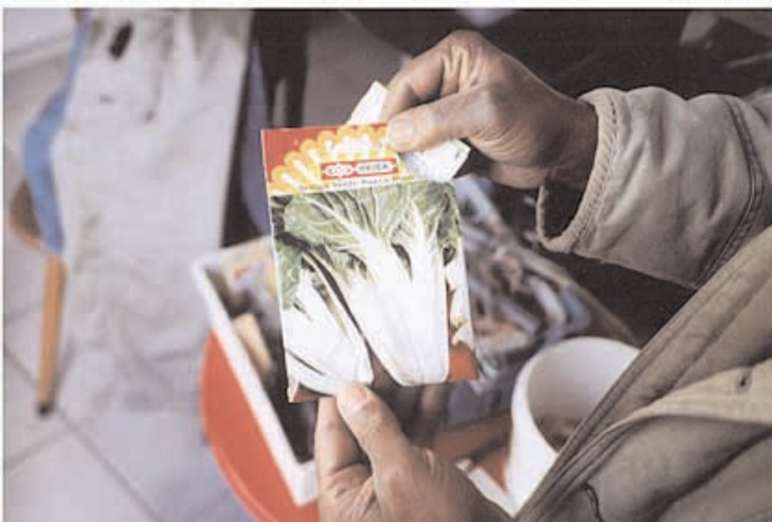
kaapverdische volkstuinder kweekt paksoi