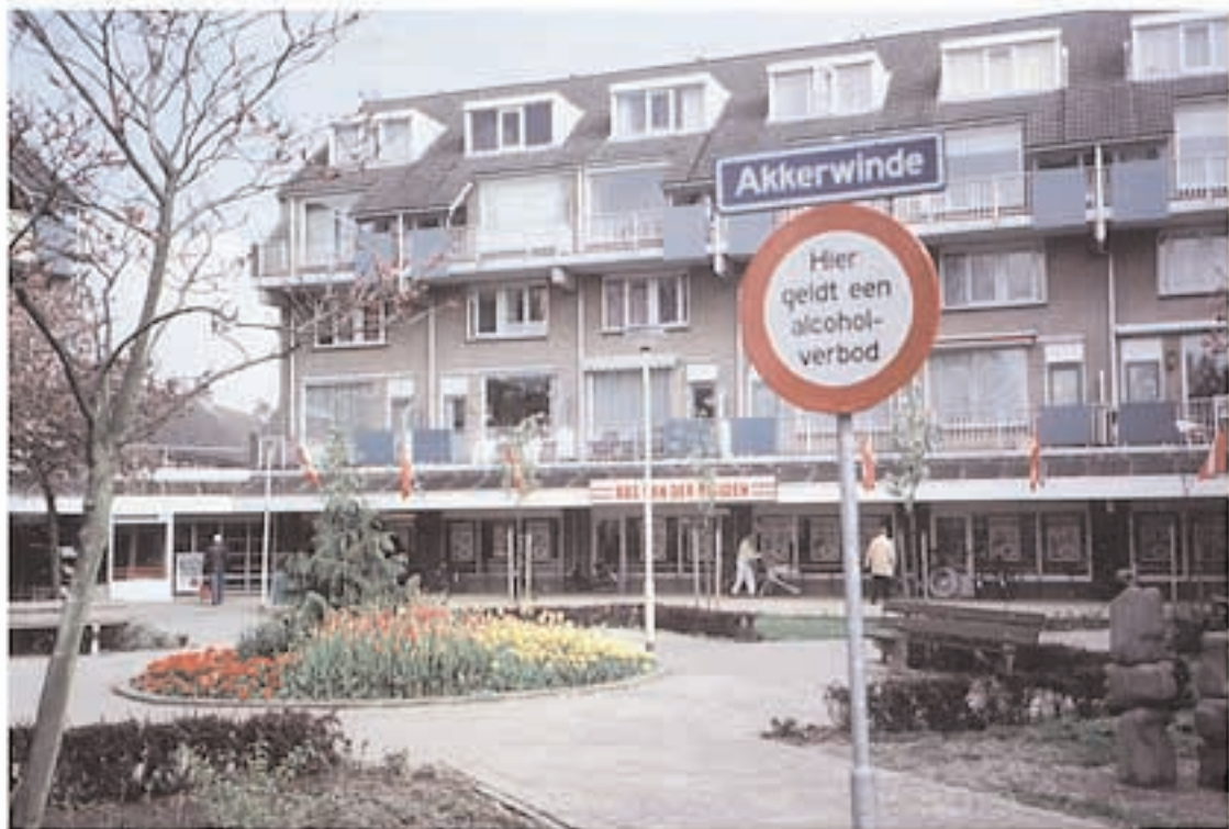
mfc boomgaardshoek ligt hierachter