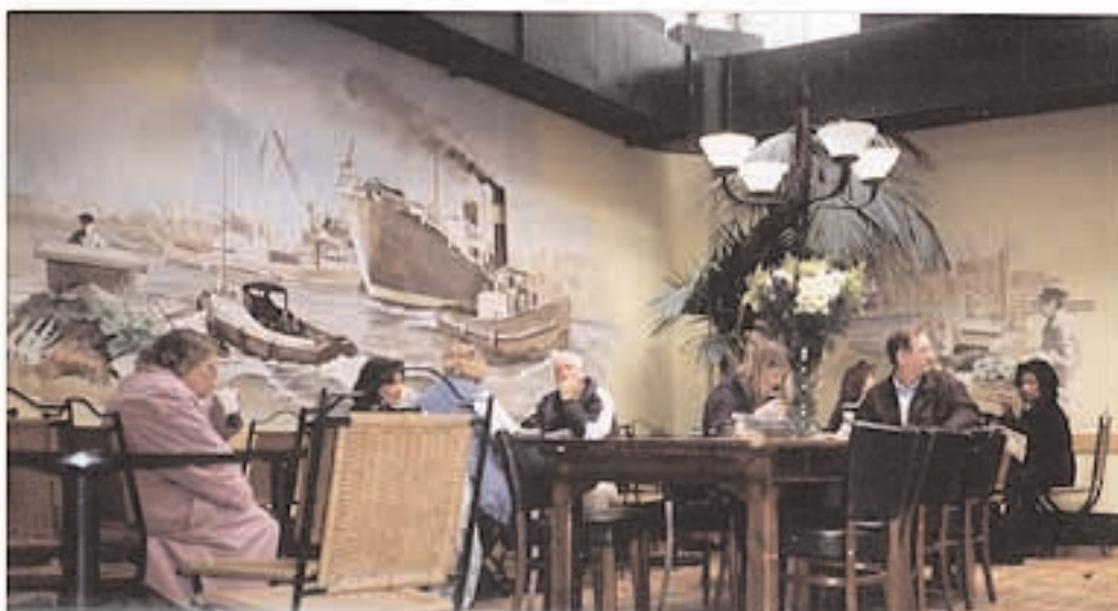
restaurant la place licht