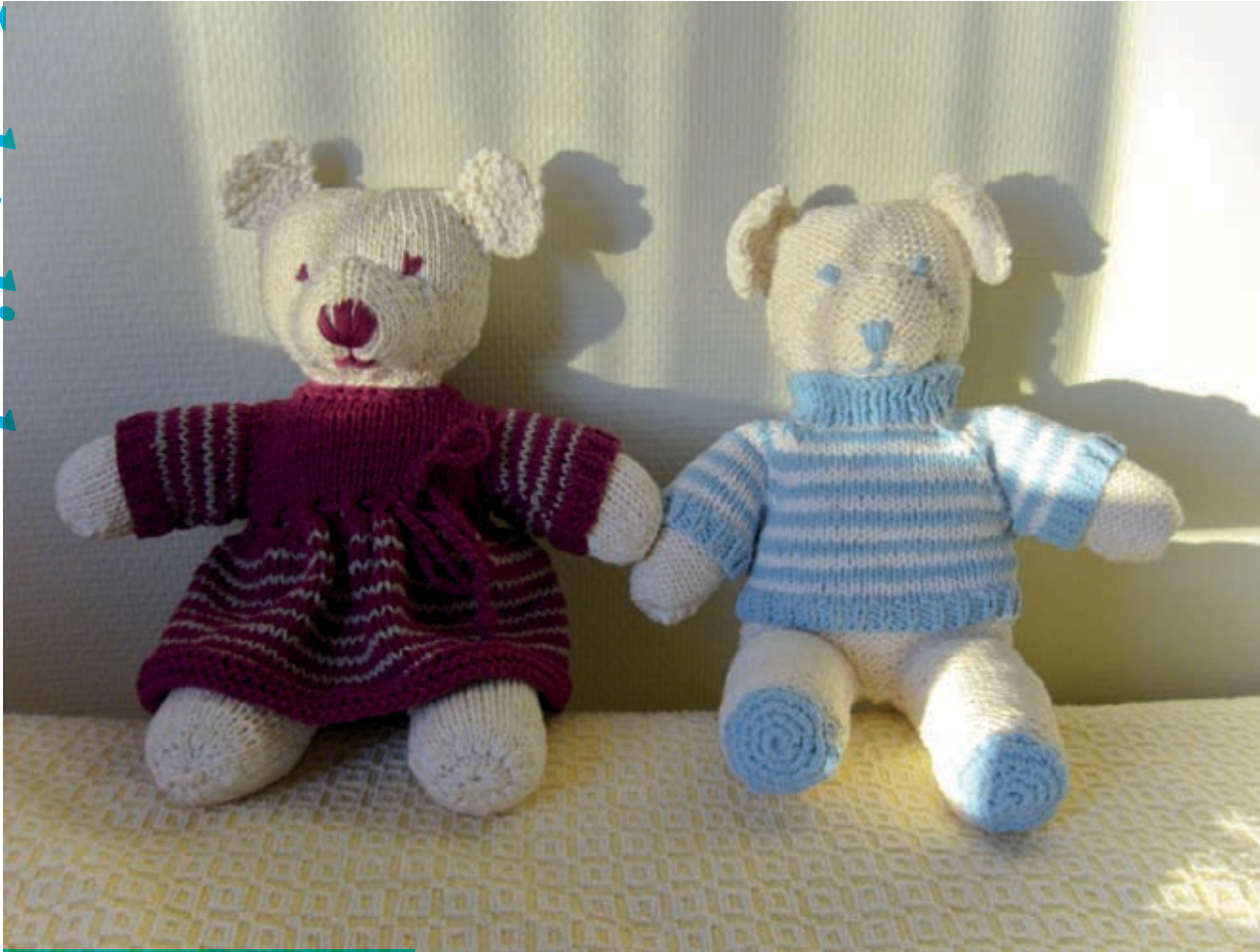
Bij haar man thuis liggen stapels beren.