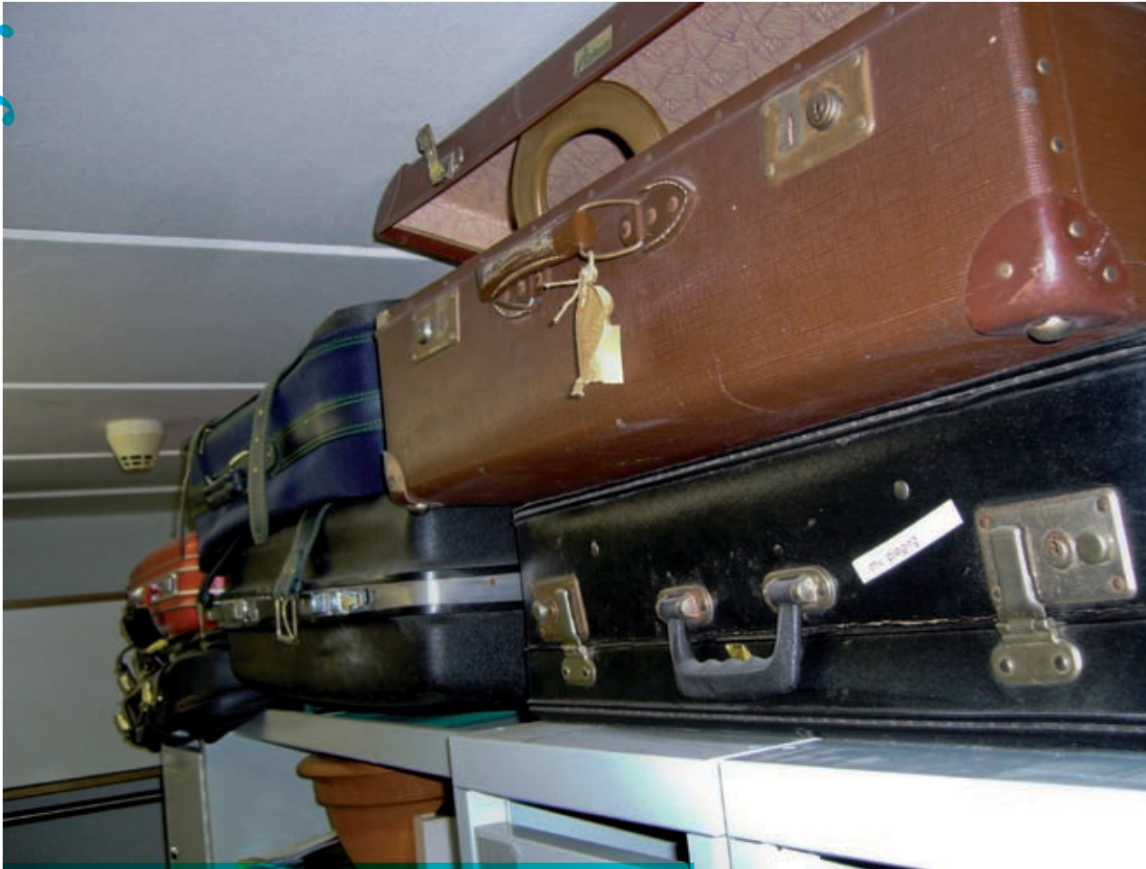
De koffers waarmee de bewoners gekomen zijn in de personeelsgarderobe.