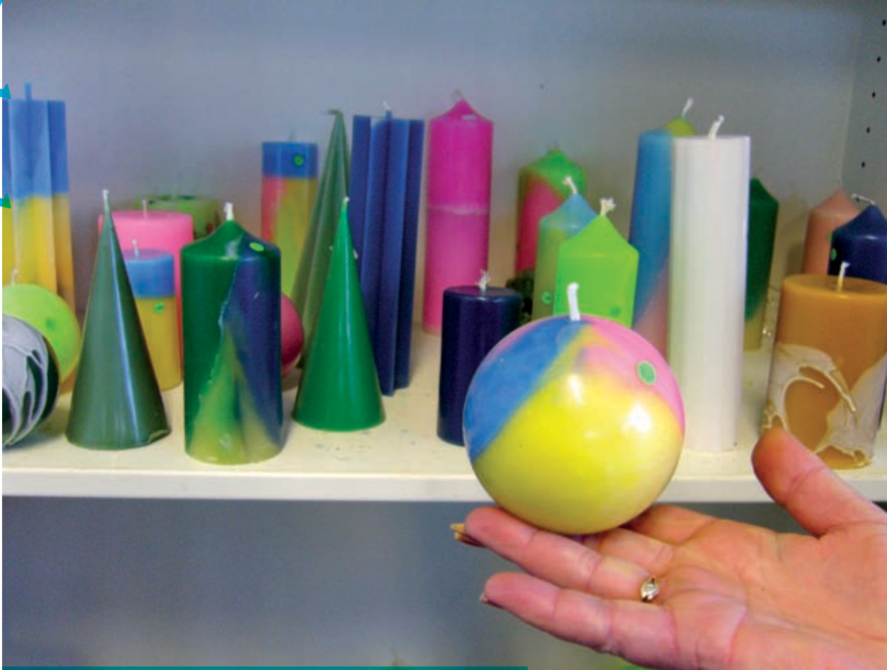
Elke dinsdag kan je kaarsen maken die worden verkocht in het winkeltje.