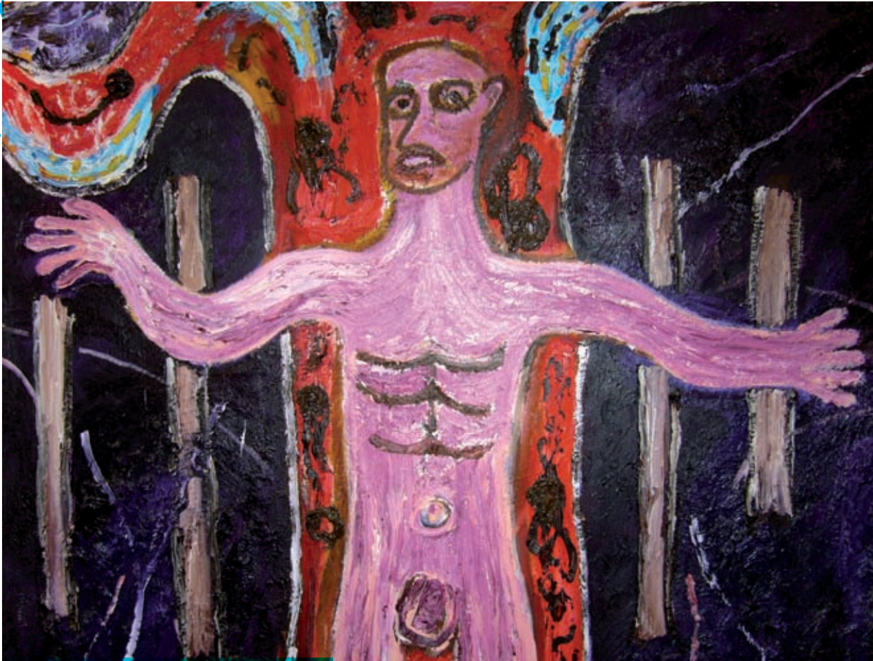
Grote doeken maakte hij, die goed verkochten.