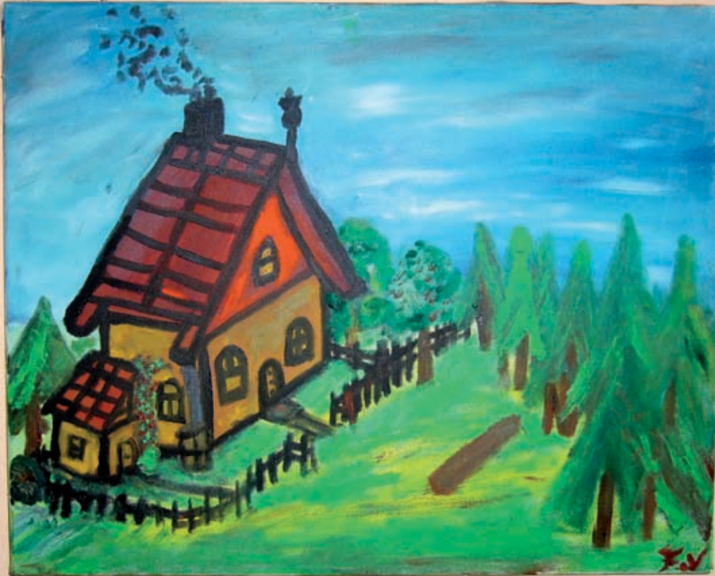
In de gang van de Linden hangen schilderijen.