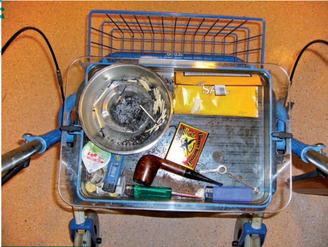
De rollators zijn wereldjes op zich.