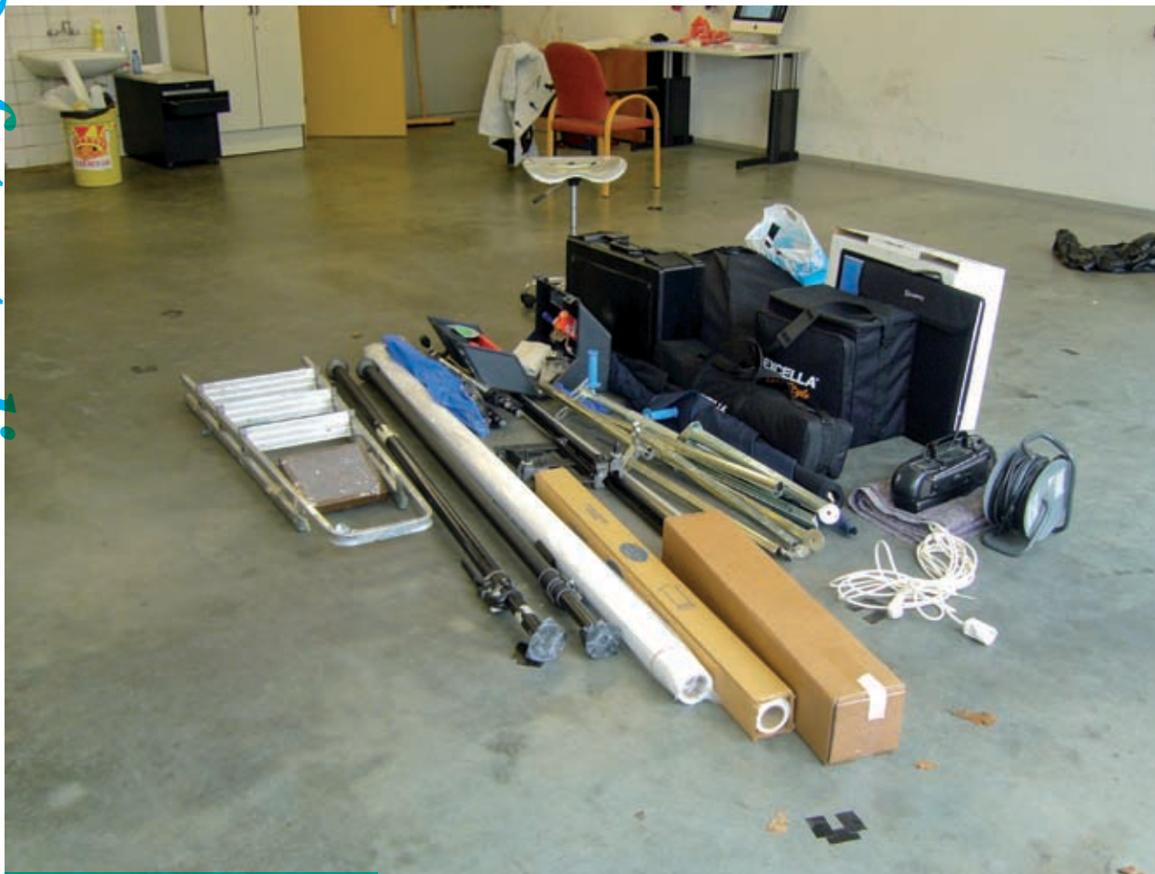
Mobiele fotostudio klaar voor vertrek.