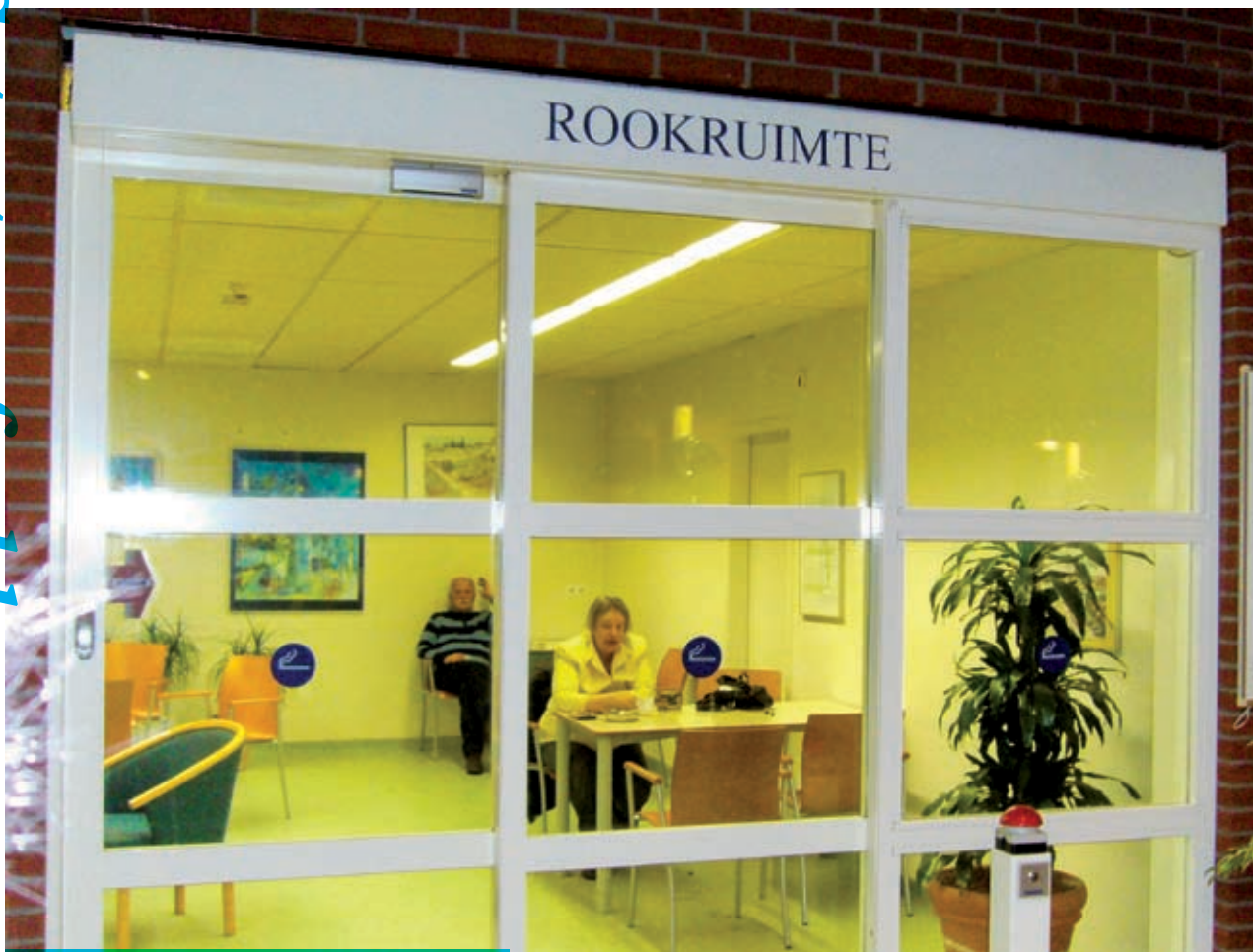
Meest sigaretten, een enkeling sigaar en één pijp.