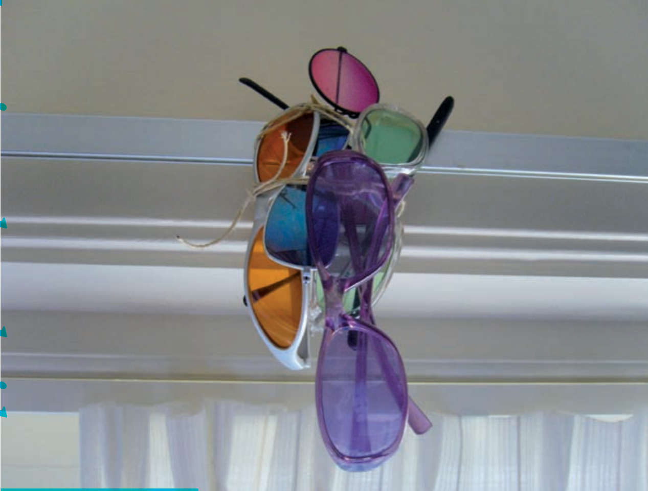
Een nest brillen aan de gordijnrail.