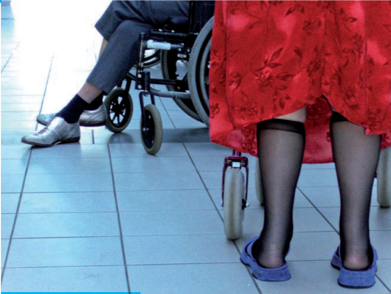
Een Amsterdammer met zilveren schoenen.