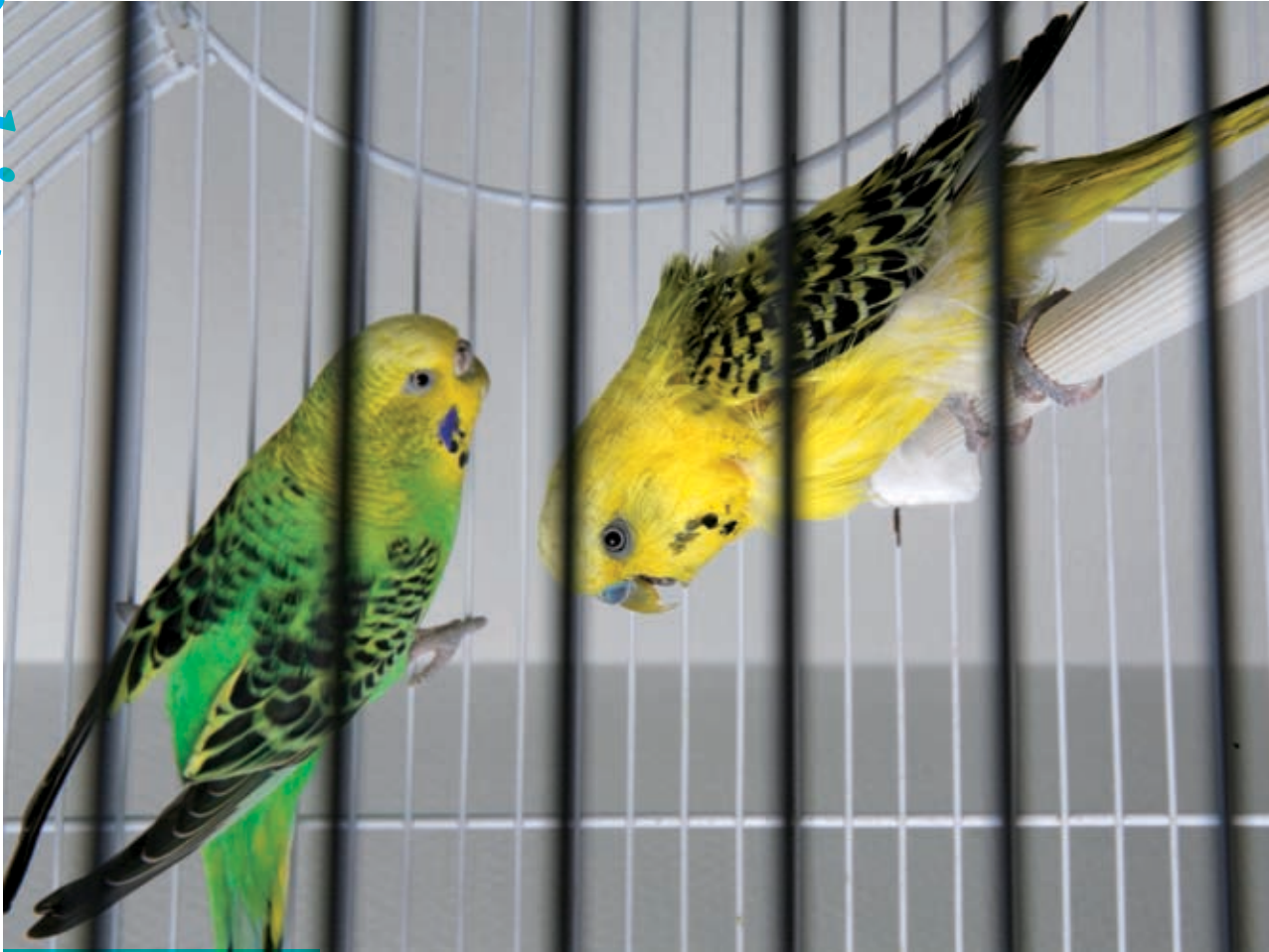
Vogels en vissen wonen hier.