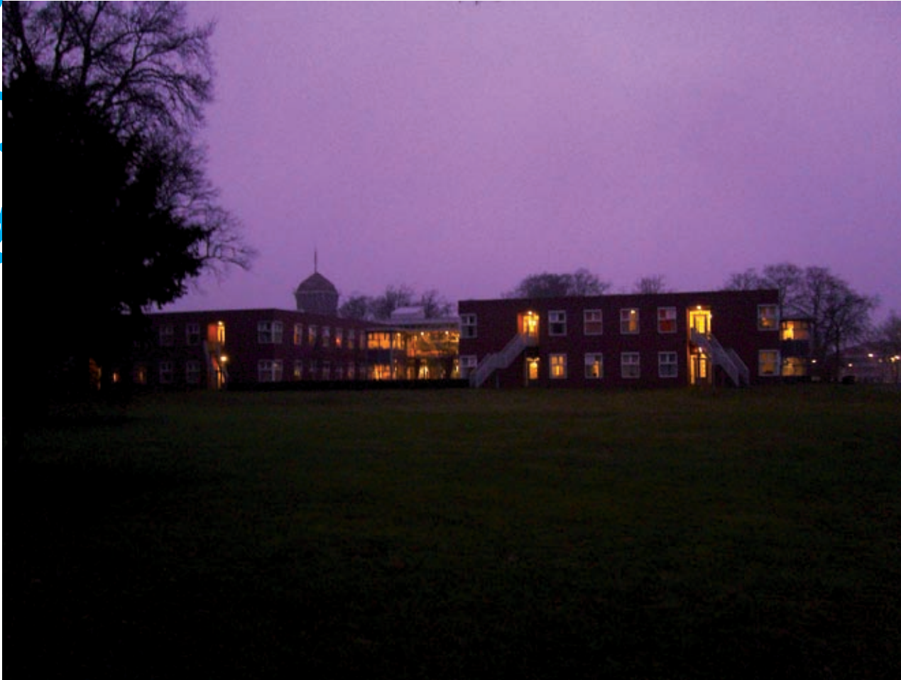
Avond valt over Eikendonck.