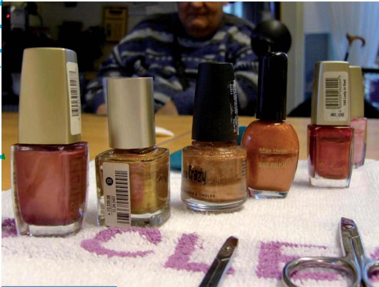
Mannen krijgen hun nagels geknipt.